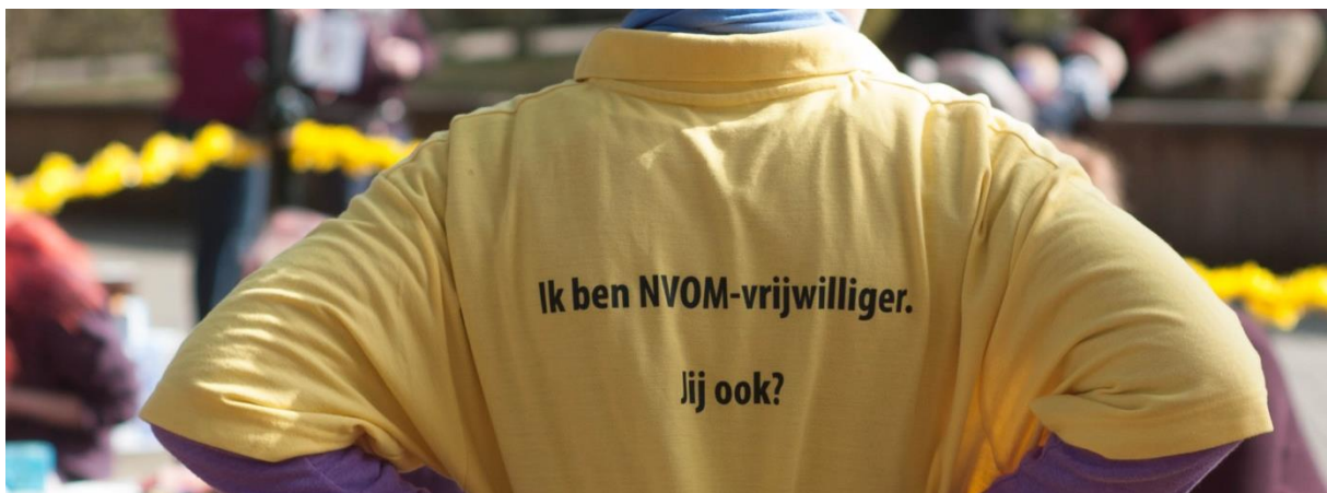
Figuur 1: Alleen door de niet aflatende inzet van de vrijwilligers van de NVOM kan de vereniging haar activiteitenpeil handhaven.

Het bestuur is bijzonder trots op deze mensen. Velen van hen combineren het vrijwilligerswerk voor de NVOM met een druk gezinsleven en vaak ook met een professionele loopbaan. Op deze plek wil het bestuur dan ook een dankwoord uitspreken aan al deze mensen.