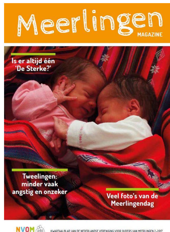
Figuur 3: Meerlingen Magazine 2017, nummer 2.

De doelstelling van het Kenniscentrum is om de positie van de NVOM als expertisecentrum op het gebied van meerlingen gestalte te geven. Het kenniscentrum dient om de kennis te borgen en te ontsluiten voor de vereniging.