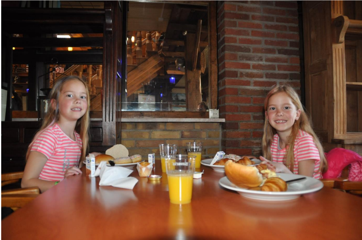
Figuur 4: Foto tijdens het Meerlingenontbijt op zondag 8 april in Attractie- & Vakantiepark Slagharen.

Het organiserend comité had haar best gedaan om de gasten een gevarieerd programma aan te bieden. Vanzelfsprekend was het Attractiepark zelf volledig toegankelijk voor alle gasten. Op het centrale NVOM plein was voldoende ruimte voor meerlingouders (-gezinnen) om elkaar te ontmoeten en ervaringen uit te wisselen.